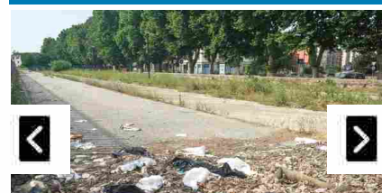
Parcheggio Tiziano: fra sporcizia e

Il tuo browser non supporta i video HTML5